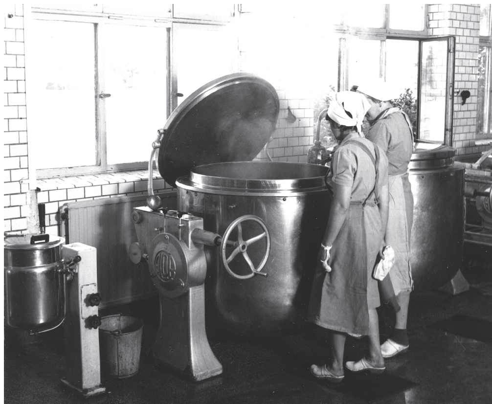
Två representanter för de civilanställda i köket på Svea livgarde 1966.

Både lotsar och fyrpersonal samt deras änkor och efterlevande barn hade rätt till gratial (underhåll) och man kan därför finna dem i Flottans pensionskassas handlingar (se s. 40).