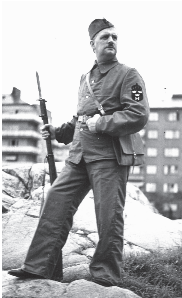
Hemvärnsman i närheten av Gärdet i Stockholm. Foto: S. Ericsson 1940 (Armé- marin- och flygfilm "Frivilliga organisationer")

Det finns 24 frivilligorganisationer i Sverige som omfattar cirka 800 000 människor. De brukar indelas i organisationer för frivillig befälsutbildning, avtalsorganisationer och övriga organisationer. Exempel på frivilligorganisationer är Centraförbundet för befälsutbildning, Svenska Blå stjärnan, Riksförbundet Sveriges lottakårer, Frivilliga Automobilkårernas riksförbund och Frivilliga radioorganisationen. Frivilligorganisationerna behöver inte lämna sina arkiv till Krigsarkivet, men i flera fall har så ändå skett. Det gäller till exempel de ovan nämnda organisationerna. Deras arkiv kan innehålla medlemsmatriklar och andra individcentrerade handlingar. Det måste dock sägas att det direkt personrelaterade materialet inte är framträdande i de bevarade arkiven. Sådant material kan, i viss utsträckning finnas i arkiven efter de ovan omnämnda hemvärns- och frivilligavdelningarna i försvarsområdenas arkiv.