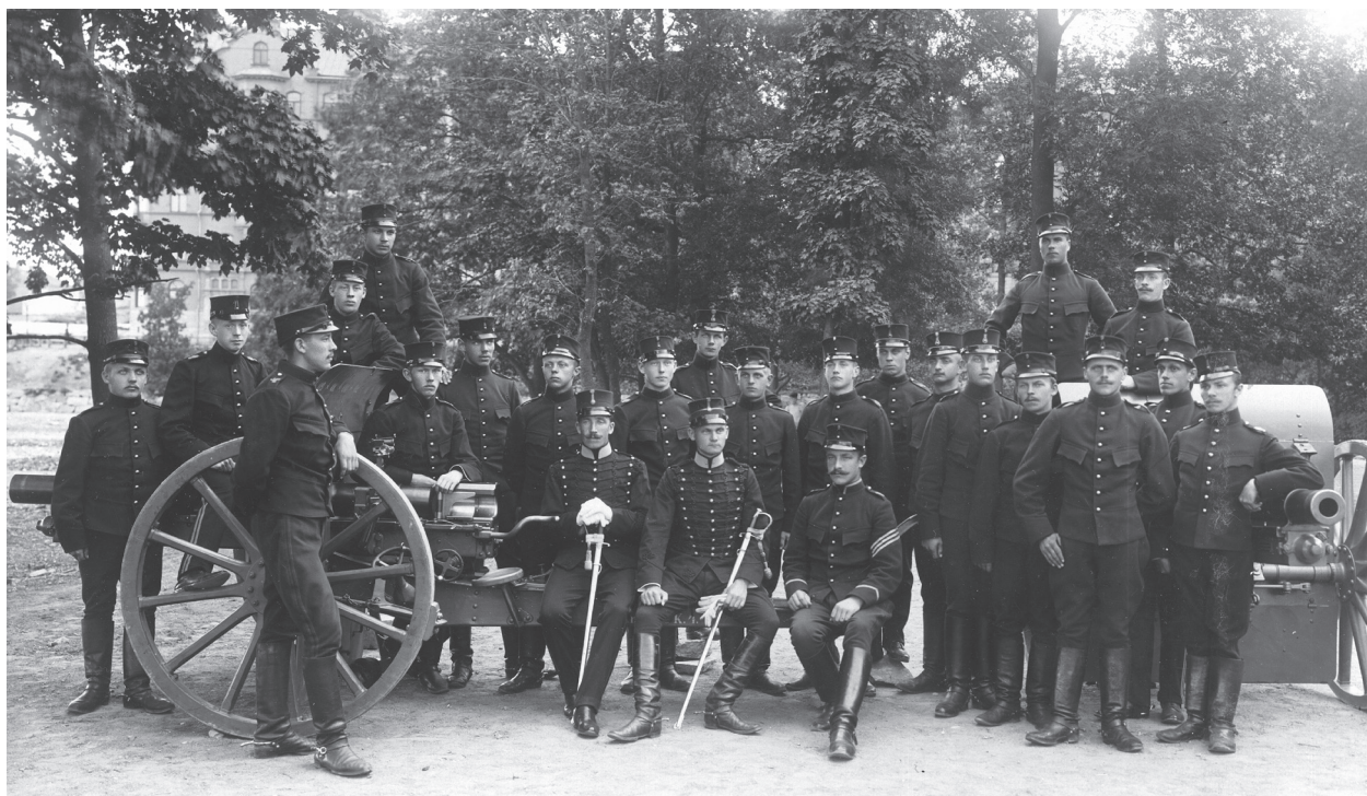
Officerare och värvat manskap vid Svea artilleriregemente. Foto: C K Thorncliff 1905. (Gruppfotosamlingen)

Rullkorten, ett för varje person, finns i förbandens arkiv. De är vanligen redovisade under mobiliseringsavdelningen, personaldetaljen. Rullkort kan även finnas i andra arkiv; såsom i inskrivningsområdenas arkiv.